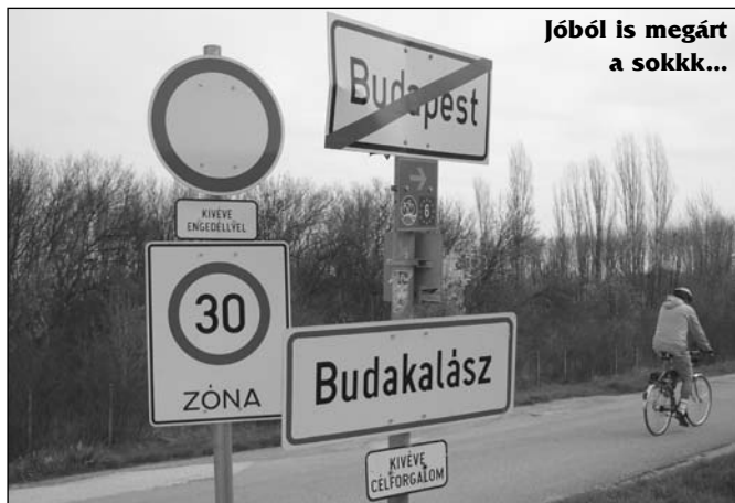
Jóból is megárt a sokk...

Egyesületünk autóbuzos kirándulást szervez: