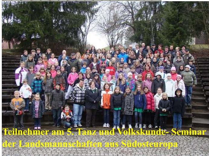
Teilnehmer am 5. Tanz und Volkskunde- Seminar der Landsmannschaften aus Südosteuropa