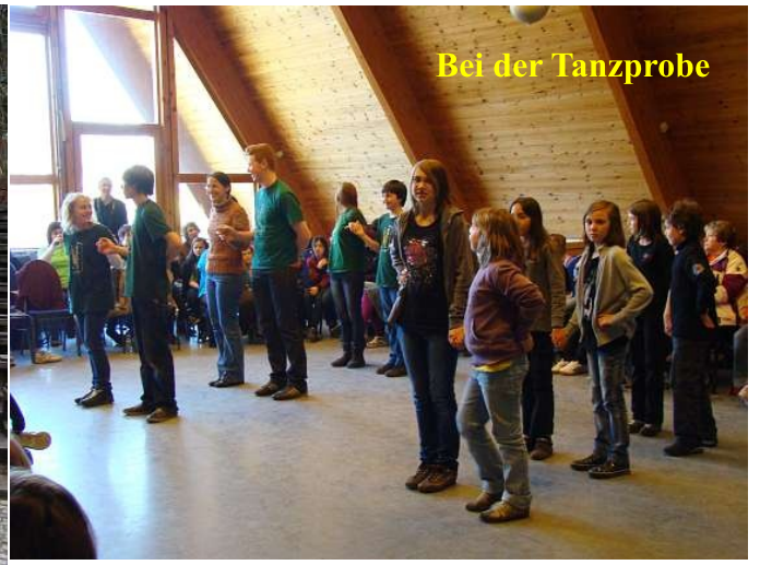
Bei der Tanzprobe