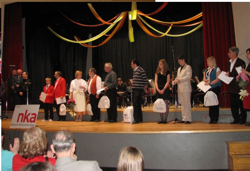
Übergabe der Urkunden und Preise an die teilnehmenden Kapellmeister

V. Jugendblasmusikfestival in Petschwar 09. April 2011