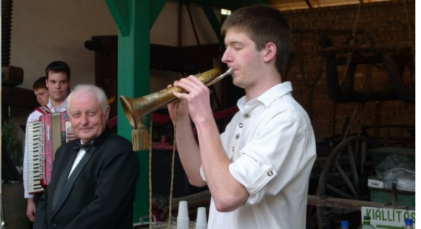
Momentaufnahmen einer Ausstellung Schaumar ALTE BLASKAPELLEN - ALTE INSTRUMENTE